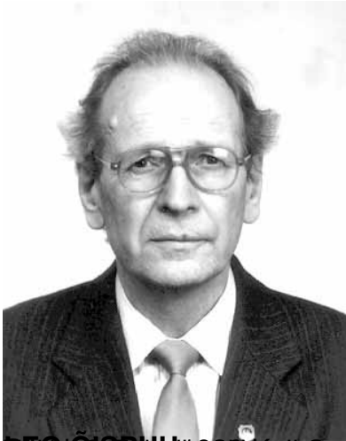
1900-1950. a. aastal Eesti NSV Riikliku Raamatukogu juhatuse esimees ja Eesti NSV Riikliku Raamatukogu juhatuse esimees juhataja.